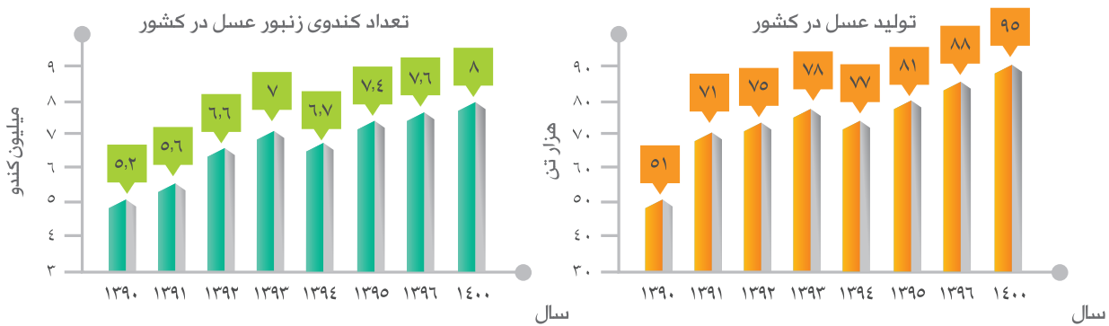
وضعیت تعداد کندو و تولید عسل در کشور طی سال‌های ۱۳۹۰ تا ۱۴۰۰

ایران با ۷/۶ میلیون کلنی و تولید بیش از ۸۸ هزار تن عسل به ترتیب رتبه چهارم و هشتم جهان را داراست. یکی از مهمترین محدودیت‌های تحقق اهداف برنامه ششم و تولید سالیانه ۹۵ هزار تن عسل، عدم دسترسی کافی زنبوداران به ملکه‌های اصلاح شده، پرمحصول و اقتصادی است. با توجه به وابستگی شدید زنبور عسل به محیط، مناسب‌ترین استراتژی اصلاح نژاد، استفاده از توده یا نژاد بومی همان منطقه و بهبود خصوصیات تولیدی و رفتاری و رفع نقاط ضعف آن توده است. با توجه به تعداد کلنی‌های زنبور عسل، ایران سالیانه به ۳/۸ میلیون ملکه نیاز دارد که با استفاده از ملکه‌های اصلاح شده با منشاء بومی می‌توان نسبت به تکثیر و توزیع آنها در بین زنبوداران اقدام نمود.